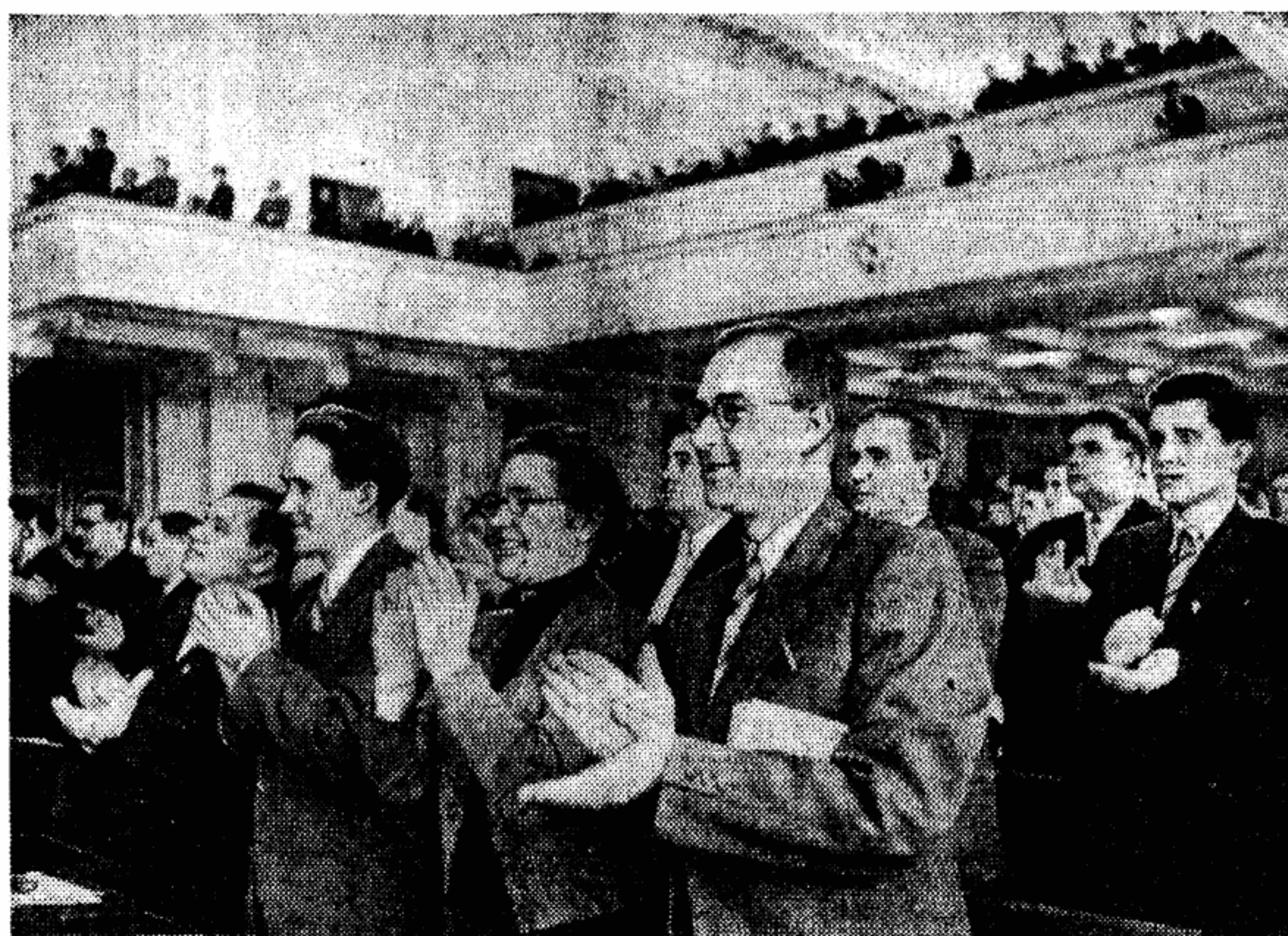
Вчера на XII съезде профессиональных союзов СССР.