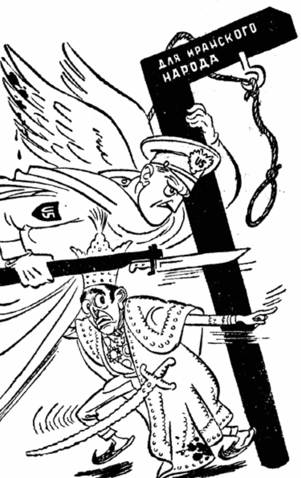
Американский агент-телохранитель шаха... Рис. Н. Лисогорского

Почему шах Ирана заключил двустороннее соглашение с американским империализмом? Потому, что он боится иранского народа. Заключив это соглашение, шах продал оптом национальную независимость Ирана американским империалистам. А те в свою очередь обязались защищать трон, отели, магазины, дворцы, поместья иранского шаха от народа.